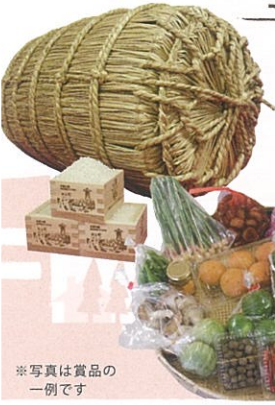
※写真は賞品の一例です