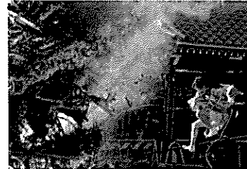
【第30回祭りの部金賞作品】

フィルムカメラ、デジタルカメラで撮影したカラープリント写真。 サイズは四つ切(ワイド可)またはA4サイズに限る。 ※組写真、合成写真、デジタル写真の画像処理は不可とする。 また、額装、台紙やパネルに貼った写真も不可とする。