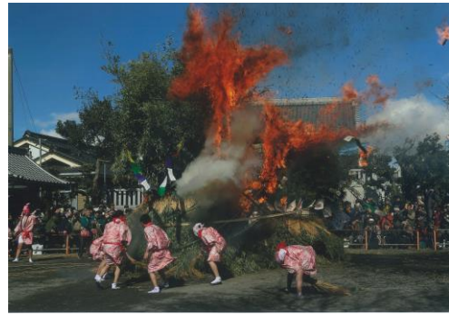
【第32回祭りの部金賞作品】

フィルムカメラ、デジタルカメラで撮影したカラープリント写真。 サイズは四つ切(ワイド可)またはA4サイズに限る。 ※組写真、合成写真、デジタル写真の画像処理は不可とする。 また、額装、台紙やパネルに貼った写真も不可とする。