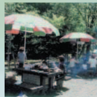
羽根谷だんだん公園