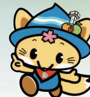
海津市マスコットキャラクター かいづっち