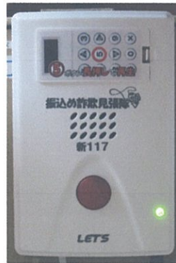
自動通話録音警告機