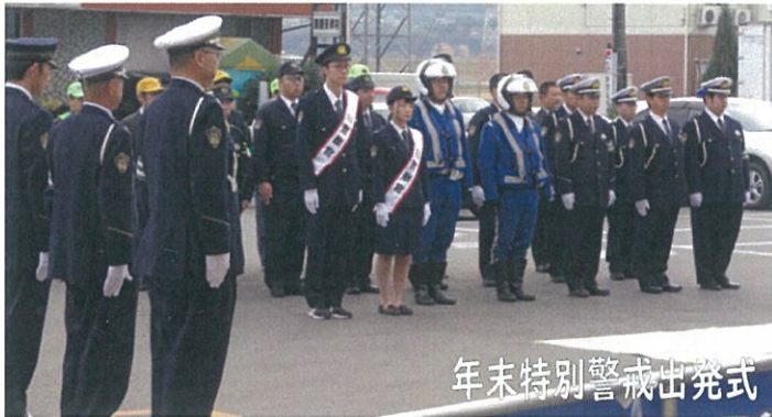
年末特別警戒出発式

を合言葉に住みよい街かいづを目指し、地域安全活動を推進してまいります。 みなさまのご協力をお願いします。