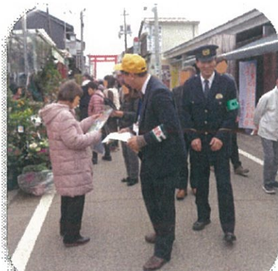
年末年始地域安全運動 広報啓発活動