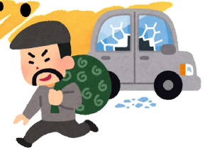
海津市内街頭犯罪発生状況 (令和2年6月末)