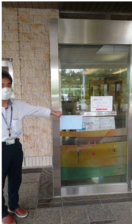
施設の玄関付近に設置