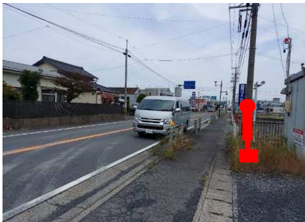
馬目停留所（市役所方面）