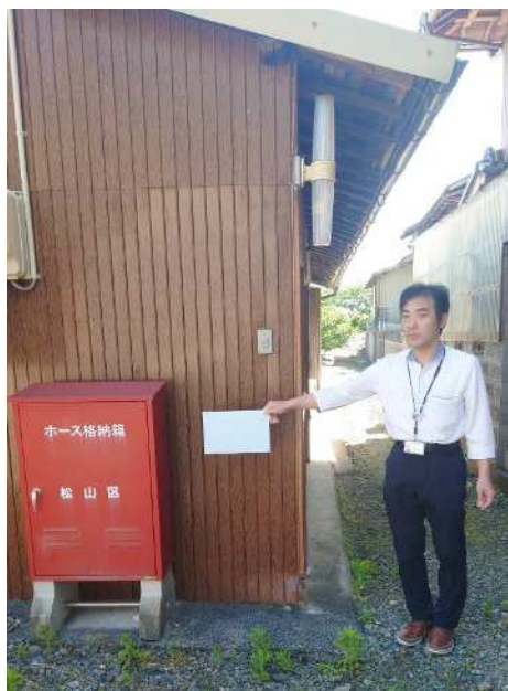
集会所敷地内に設置