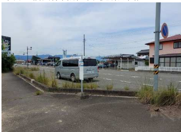
東海大橋西停留所（市役所方面）