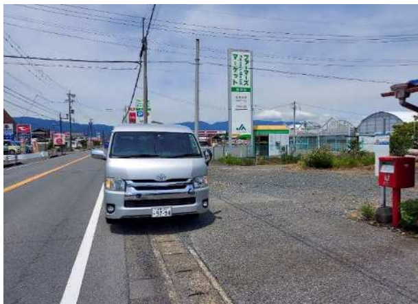
馬目停留所（津島駅方面）