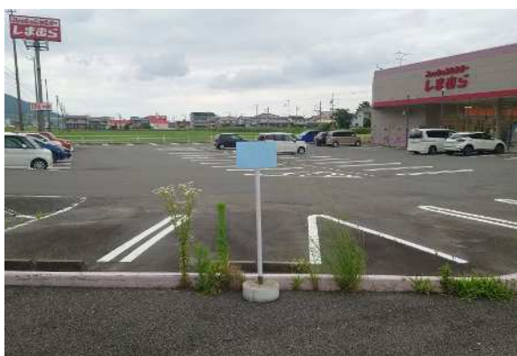
店舗南側道路に設置