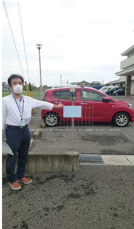
施設の駐車場内に設置