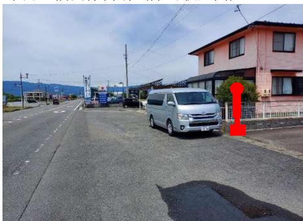
東海大橋西停留所（津島駅方面）