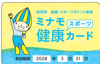
▲ミナモ健康スポーツカード