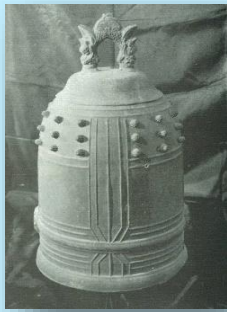
旧大江国民学校の鐘