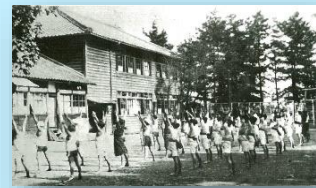
大正13年頃の西江小の様子