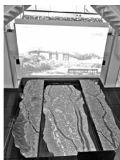
木曽三川ストーリーズ

さらに、「輪中のなりたちや工夫、河川改修の歴史を貴重な資料をもとに伝え、また多くの学校団体の見学を受け入れるなど、治水の歴史と水災害に対する防災の重要性を伝えている施設」として、令和7年12月に「NIPPON防災資産」の認定を受けました。