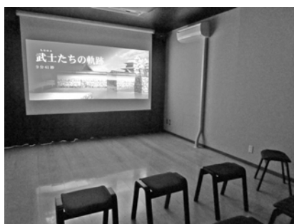
ガイドンスシアター