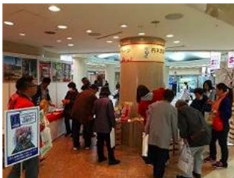
国内観光プロモーション