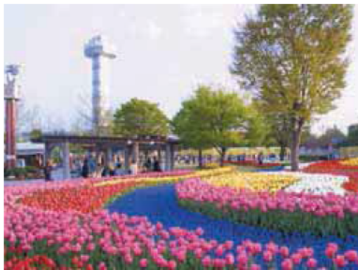
県内有数の広さと入込客数を誇る「木曾三川公園」