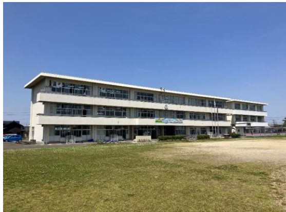
校舎等の外観写真