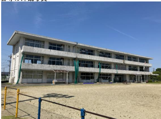
校舎等の外観写真