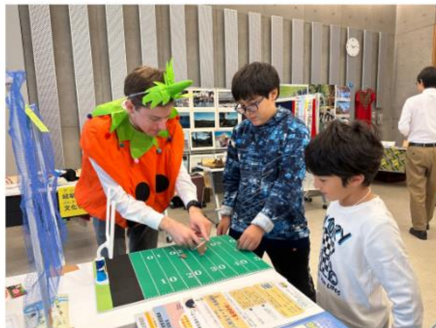
国際交流員によるブース出展の様子