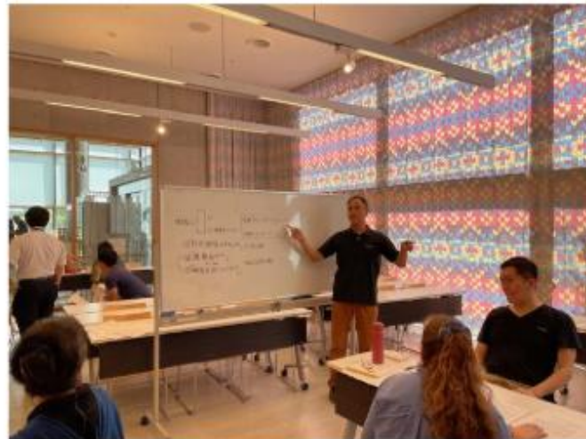
さいがいじごがく けんしゅう ようす ←災害時語学ボランティア研修の様子

さいがいじ たげんごしえん せっちくんれん ようす 災害時多言語支援センター設置訓練の様子→ けんこくさいこうりゅう ない せっち さいがいじごがく 県国際交流センター内に設置され、災害時語学 ボランティアの派遣や翻訳業務、多言語による じょうほうはっしん おこな 情報発信を行います。