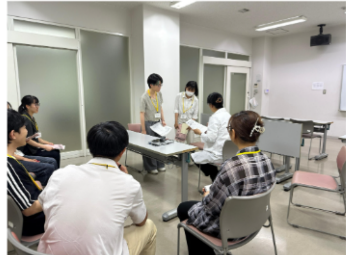
けんしゅう ようす ロールプレイ研修の様子

れいわ ねん がつげんざい けんない いりょうきかん 令和8年2月現在、県内18の医療機関にボランティア はけん とうろく を派遣。(登録ボランティア42名)