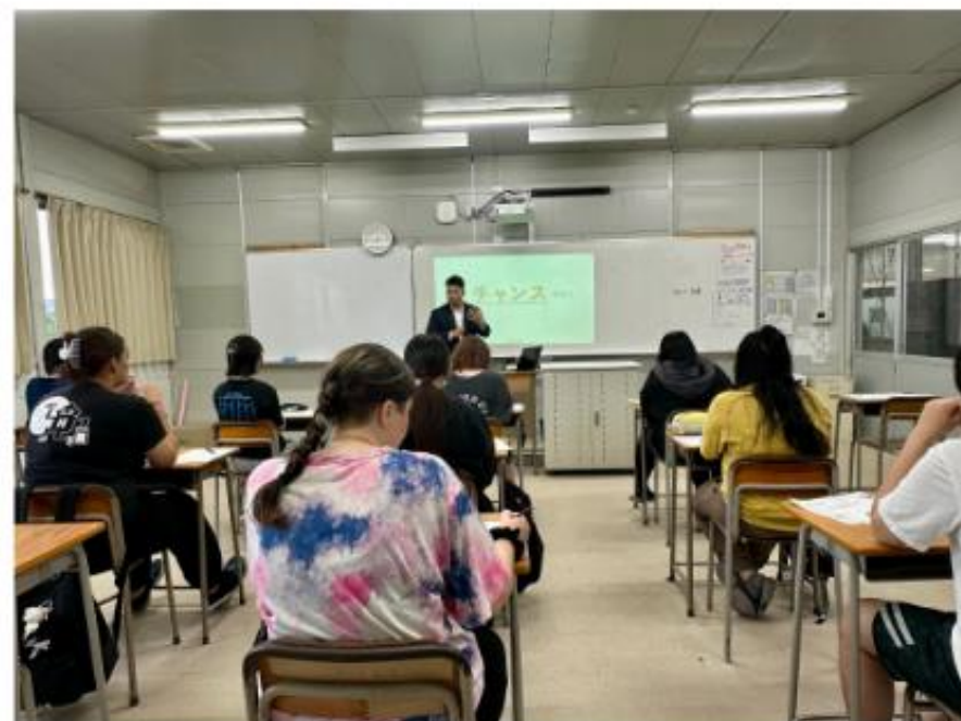
キャリア教育支援講座のようす