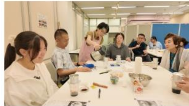
国際交流員による文化講座の様子