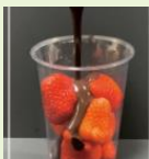
岐阜いちの ストロリー チョコレート