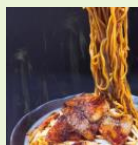
飛騨豚スタミナ 焼きそば