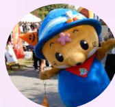
かいづっち 海津市マスコットキャラクター