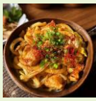
国産牛ホルモン 焼うどん