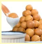
焦しバターの ベビーカステラ