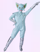
ツイーカ 海津市に辿りついた宇宙人